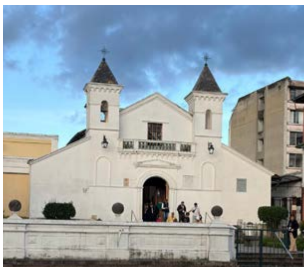
Igreja El Belén (Equador).

O sábado, dia 14, iniciou-se com Adoração Eucarística, que precedeu a Missa de encerramento do jubileu dehoniano, presidida pelo Superior Geral na Basílica do Voto Nacional, o qual enviou e exortou os presentes a continuarem seguindo as pegadas de seu fundador, neste carisma que permanece atual na Igreja de Jesus Cristo. Ao final da missa, foi lida a “mensagem final”, que também se encontra neste número do Informativo CELDE.