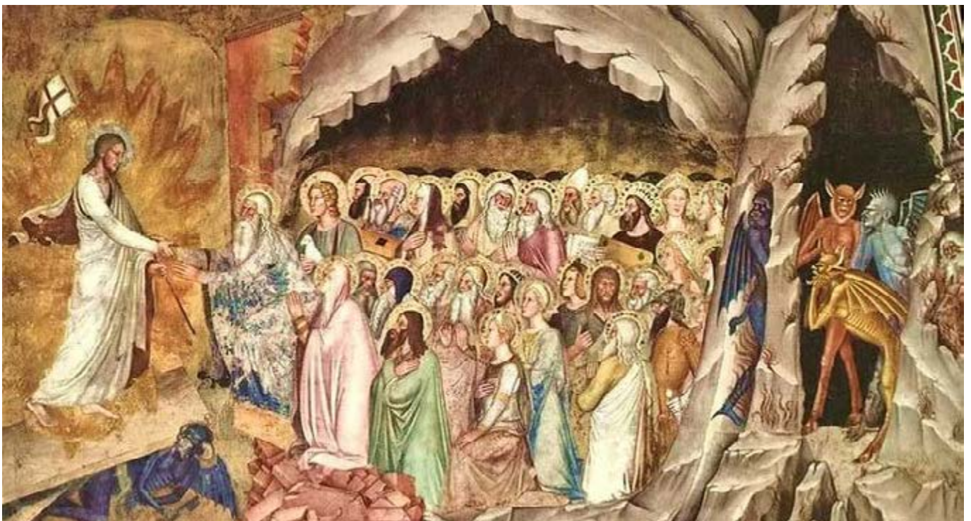
“A Descida de Cristo ao Limbo”, pintado por Andrea Bonaiuti (entre 1365 e 1368).

Dentre as muitas notas marcantes de Cst 4, propusemo-nos a evidenciar três elementos mais relevantes: a) a sensibilidade ao pecado; b) dentre as diversas causas dos males da sociedade, a recusa ao amor de Cristo; c) a união íntima com o Coração de Cristo.