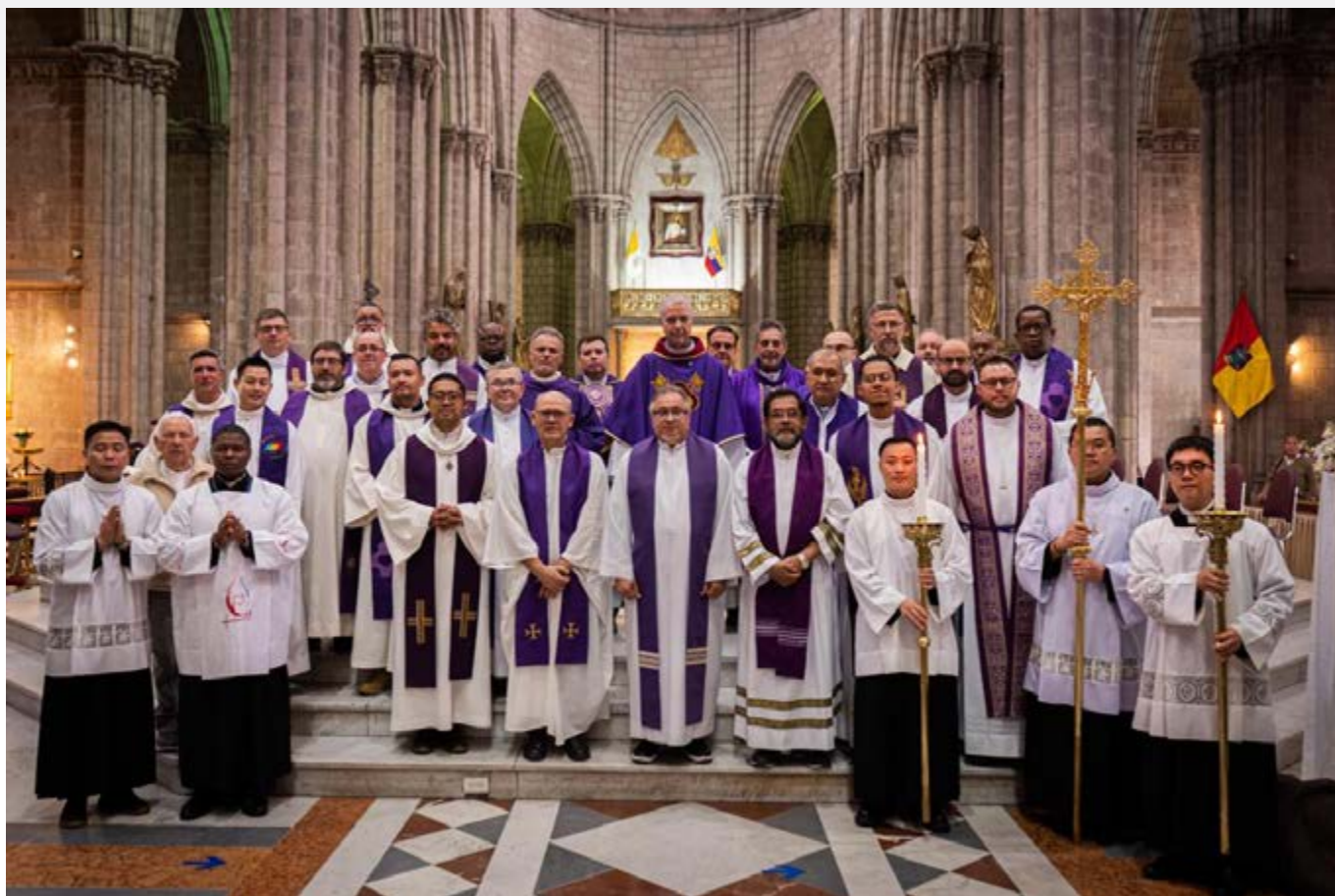
Celebração de encerramento na Basílica del Voto Nacional (Equador).

mundo” e uma peregrinação entre a Basílica do Voto Nacional e a Igreja El Belén , sede da primeira comunidade SCJ em Quito, em 1889. Ali foi realizada uma comovente Adoração Eucarística.