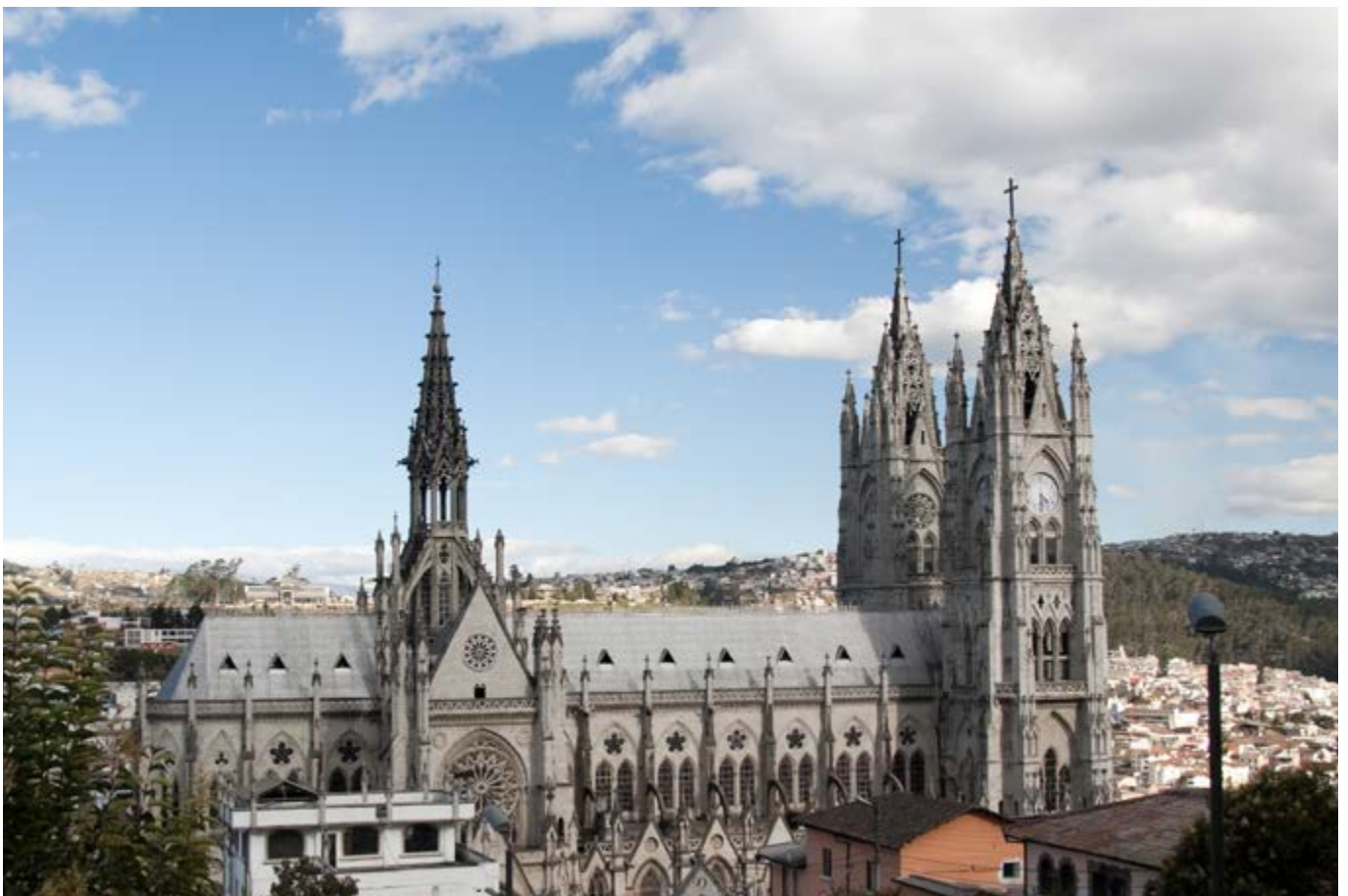
Basílica del Voto Nacional (Equador).

Recentemente, inserido na moldura do período jubilar de 2025 a 2028, foi realizado um evento congregacional em Quito (9 a 14 de março): o Jubileu de Quito! A escolha da capital equatoriana se deve ao fato de ter sido o local da primeira missão ad gentes da jovem congregação, exatamente dez anos após sua fundação. Embora tenha perdurado apenas oito anos (1888-1896), a missão no Equador representa um marco fundamental na história do Instituto, sendo