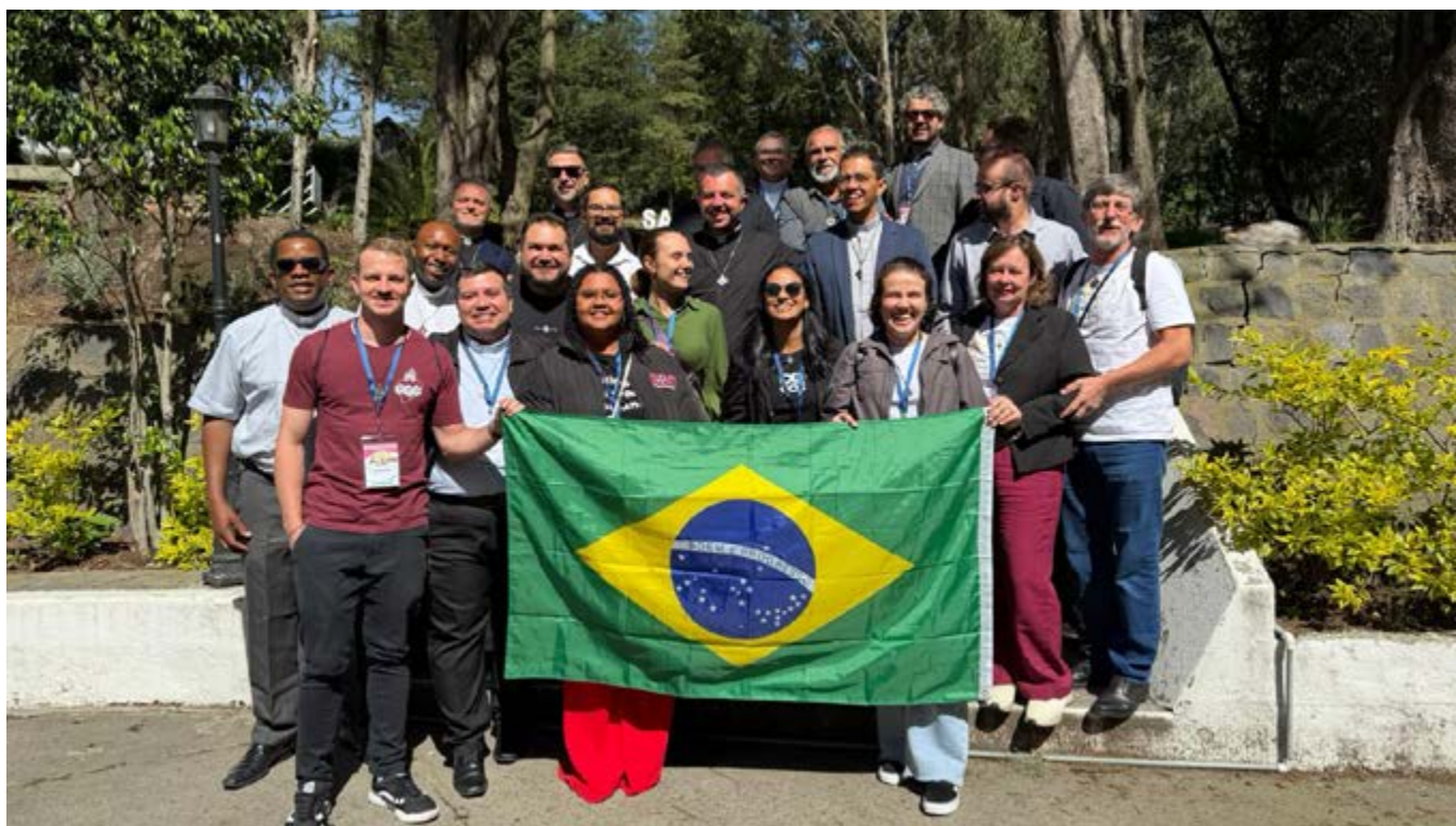
Delegação brasileira em Quito (Equador).